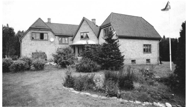
Mušu lielā dzīvojama eka, kurā mitinās 13 pusaudži

Paldies, ka uzticaties darbam, ko darām!